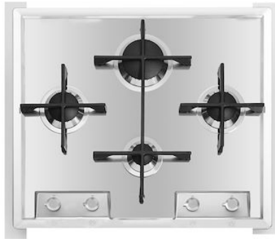
Table de cuisson Veronika